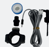
Kit détecteur de débit