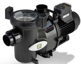
Pompe de filtration