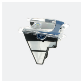
Bac filtrant (3L) débris fins 100 microns