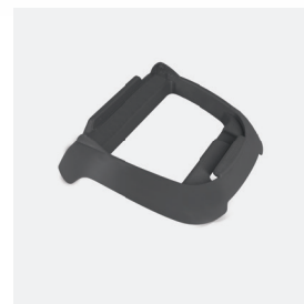
Socle pour boîtier de commande