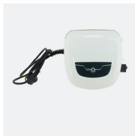
Boîtier de commande