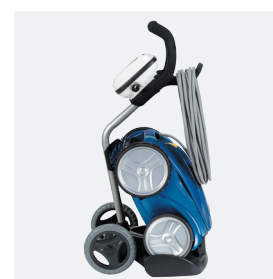
Chariot de transport

Facile d'accès et de grande capacité (5 litres)